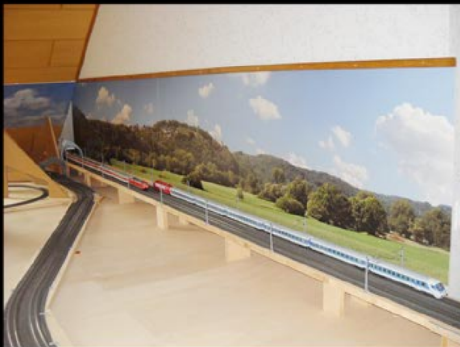
H0 - Anlage im Rohbau