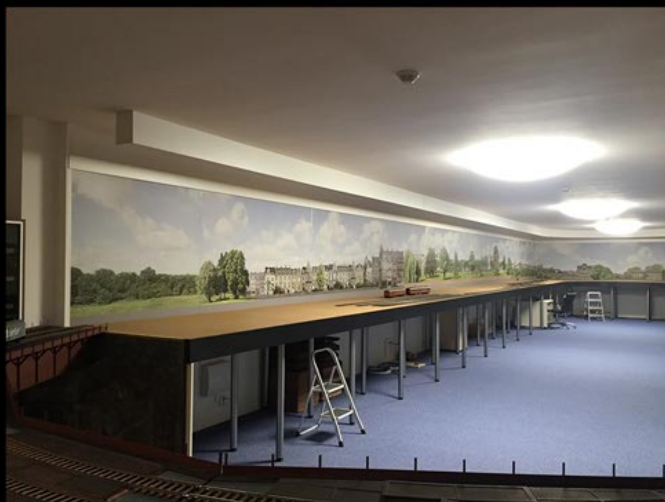
Spur-1-Anlage nach französischem Vorbild; Hintergrund mit Tag-Nacht-Effekt