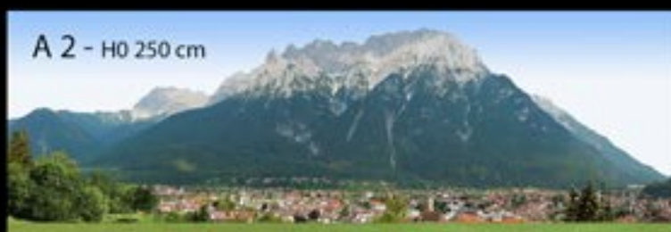
A 2 - H0 250 cm