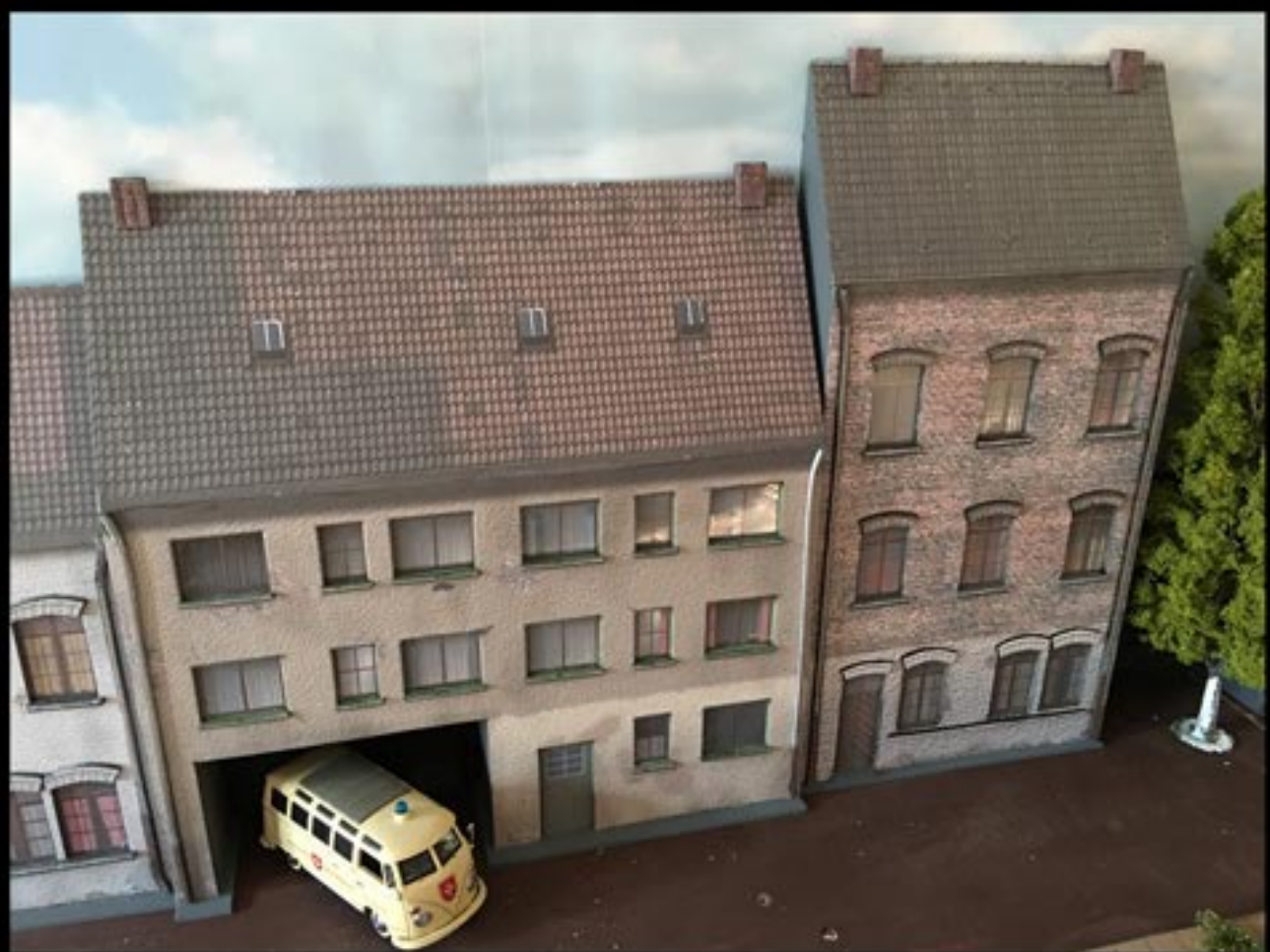
Halbreliefgebäude von CD „Hinterhöfe“ - H0-Vorlagen wurden auf Spur 0 vergrößert