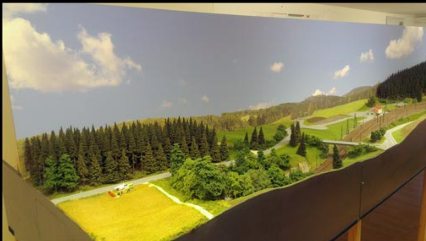
Spur-N-Anlage MEC Stetten