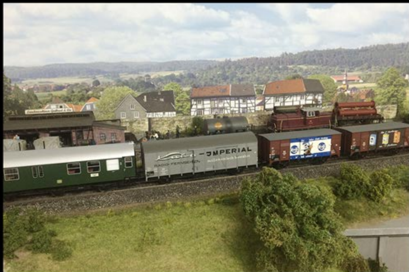
Spur-0-Anlage Wolfgang Baumann, Büro 44