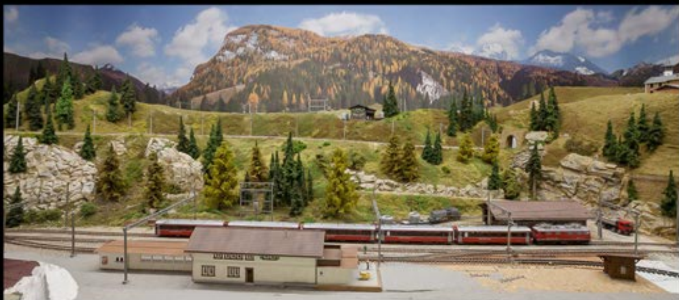
H0m - Anlage - Rhätische Bahn