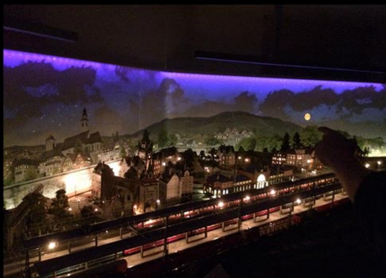
H0-Anlage; Hintergrund mit Tag-Nacht-Effekt