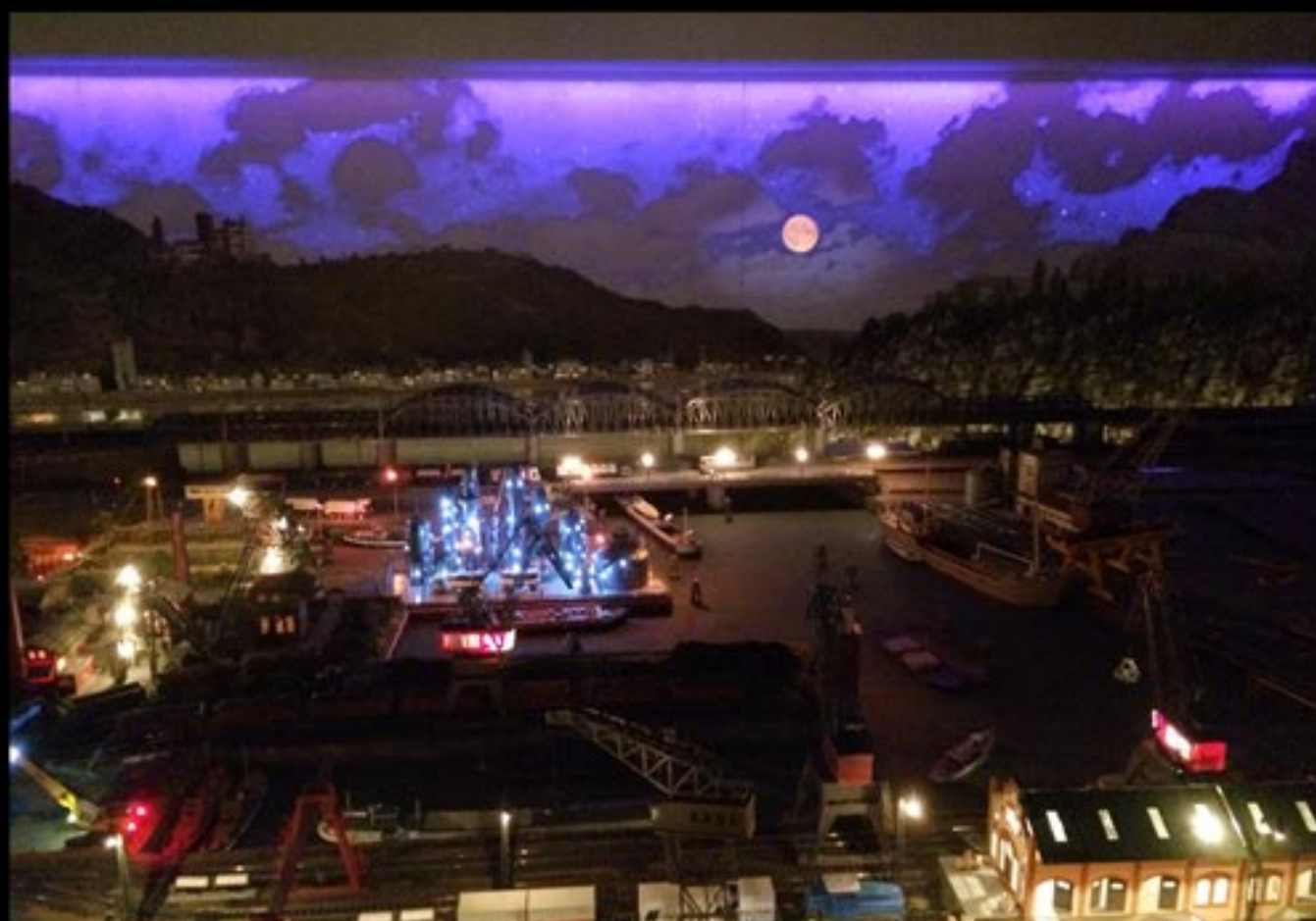
H0-Anlage; Hintergrund mit Tag-Nacht-Effekt