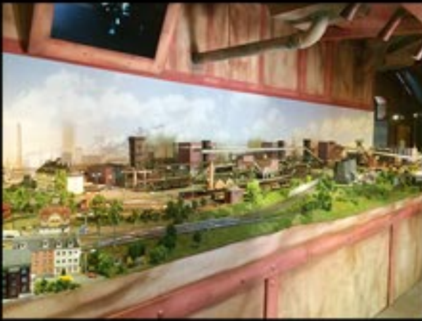
Märklin H0-Showanlage „OKTORAIL“ in Essen 140m-Hintergrund mit Tag-Nacht-Effekt