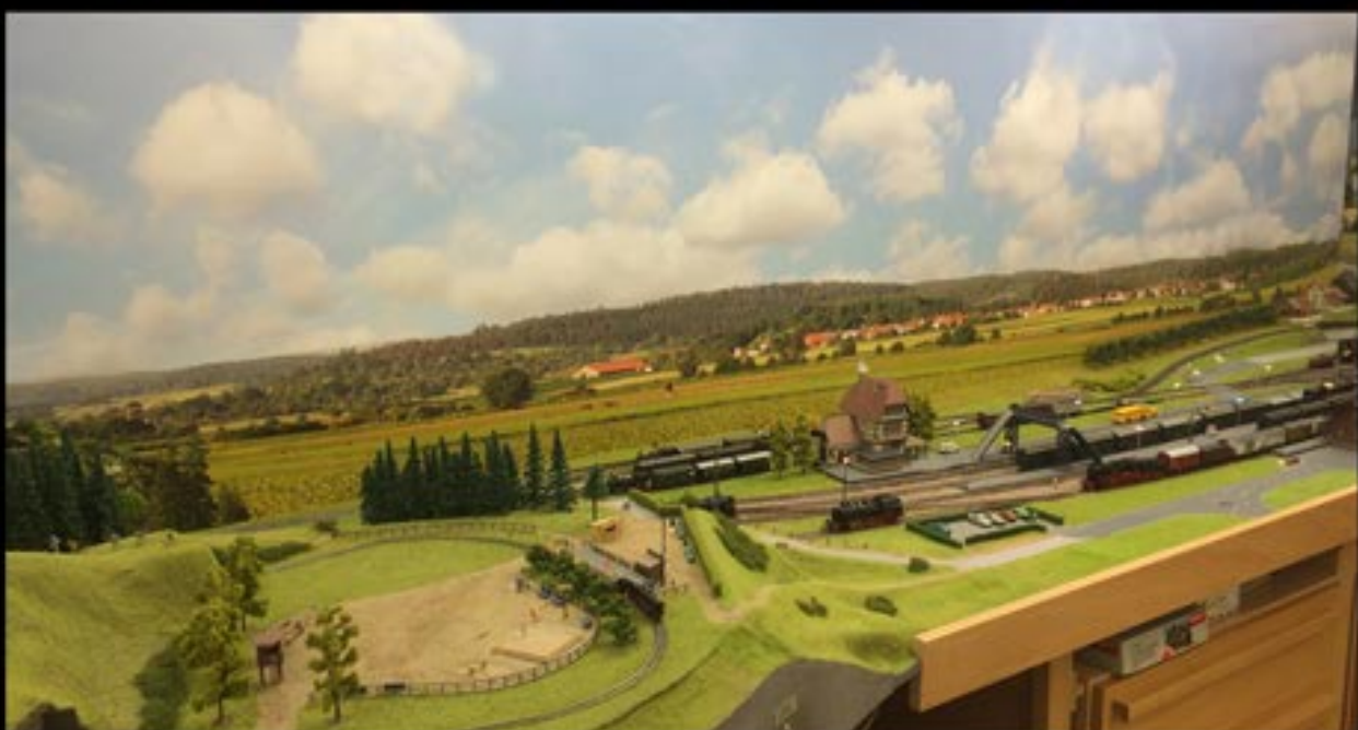
H0-Großanlage PEC Winnenden